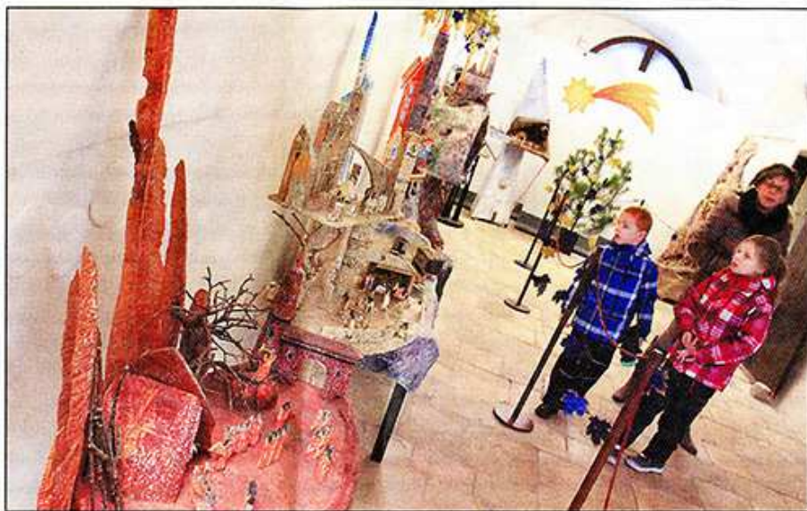
MODERNÍ BETLÉMY s originálními tématy na výstavě v Muzeu Vysočiny Jihlava.

Celá výstava má název „... a s Ním přišla Spása“. Ve výstavním sále v přízemí muzea dopl-