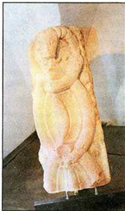
ZŘEJMĚ požárem začervenalý románský pletenec

V době osvícenství ve 2. polovině 18. století zažila lapidária svůj rozkvět. Byly do nich přemísťovány originály sochařských děl, často poškozené, které byly na původních místech nahrazovány kopiemi. V lapidáriích svého času