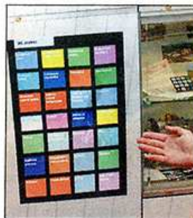
DOTYKOVÝ DISPLEJ umožňuje volit z 28 témat.