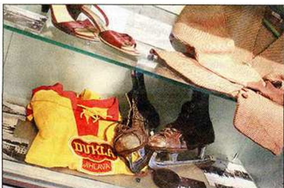
BRUSLE Stanislava Neveselého, jeden z originálních exponátů ve vitríně pod časovou osou.

Na dlouhé stěně, v prosklených nikách, vše doplňují tři kostymované figuriny: legionář v uniformě z roku 1918, muž v civilu po druhé světové válce a slečna v typickém oblečení šedesátých let.