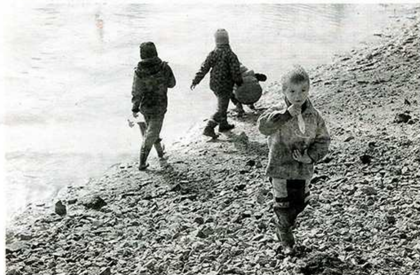
Z VÝSTAVY PODZIMNÍ SKLIZEŇ, SUŠ grafická, Kavárna Muzeum.

li v období let 2011 až 2013. „ Někteří z nich mají ambice jít dál studovat fotografii nebo další příbuzné obory na AMU, “ dodal jejich pedagog J. Ernest.